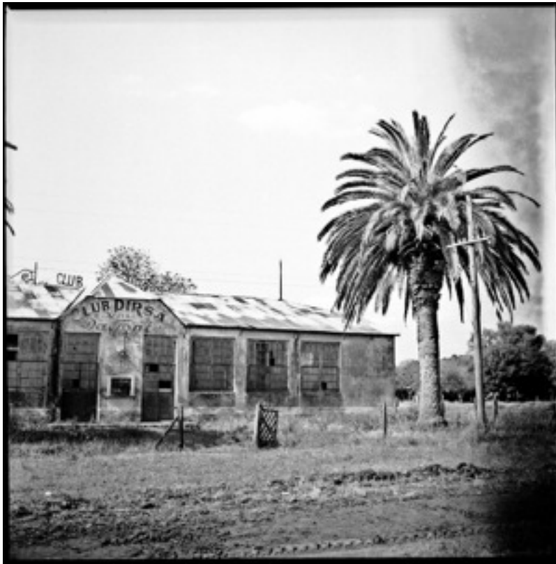
Club Dirsa de Villa Dafonte

establecimientos rurales con los colonos que habían sobrevivido a tantas ofertas de lucro, gozado de buenas salud y sufrido pocas “fatalidades”. Según dónde, tuvieron los profesionales-agricultores entre 200 y 2000 hectáreas, compraron maquinaria, arreglaron cascos y corrales, gastaron en camionetas y en el aeroclub del pueblo. Los chacareros perdedores les dejaron a estos dichosos nuevos propietarios casas abandonadas que se hicieron monte y clubs sociales sin adherentes donde nadie baila.